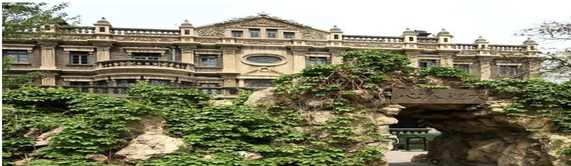
(장작림, 장학량 저택 张氏帅府)

봉천계(奉天系) 군벌의 수령이었던 장작림(张作霖)과 그의 장남인 장학량(张学良)의 관저 겸 사택. 1914년에 창건되었고 부지면적은 3만 평방미터에 달하며, 당시 동북지방의 패권을 장악했던 장씨 일가의 옛 모습을 보여주고 있음