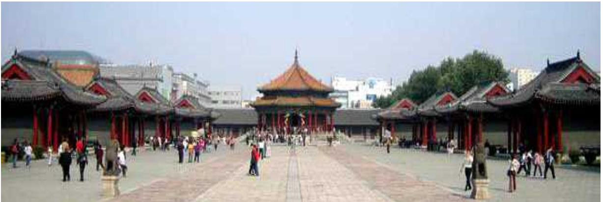
(청나라 발원지 - 선양 故宫)

1625년, 여진족 국가인 后金이 랴오양(辽阳)에서 선양으로 천도하며 1636년에 지어진 왕궁으로 清朝건국의 기초를 닦은 태조 누루하치(努尔哈赤: 1559-1626년)와 태종 황타이지(皇太极: 1592-1643년)가 실제로 이 궁에 거주하였음. 청나라 황실이 북경으로 천도하기 전까지 청나라의 첫 번째 궁이었으며, 6만 평방미터의 부지에 만주식 건물의 특징을 지닌 90여 개의 건축물로 구성되어있음