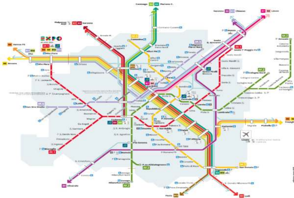
밀라노 지하철 노선도