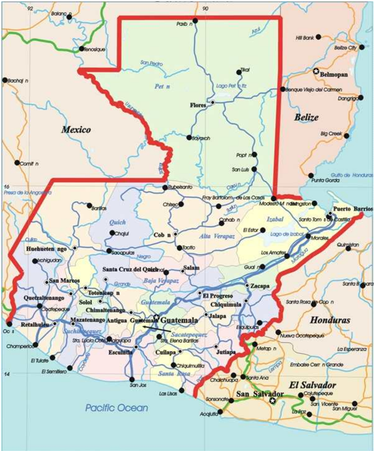
1992 MAGELLAN Geography/SMSanta Barbara, CA (800) 929-4627