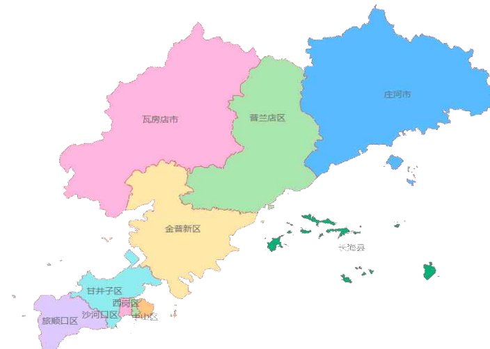
<다롄시 전체 지도>