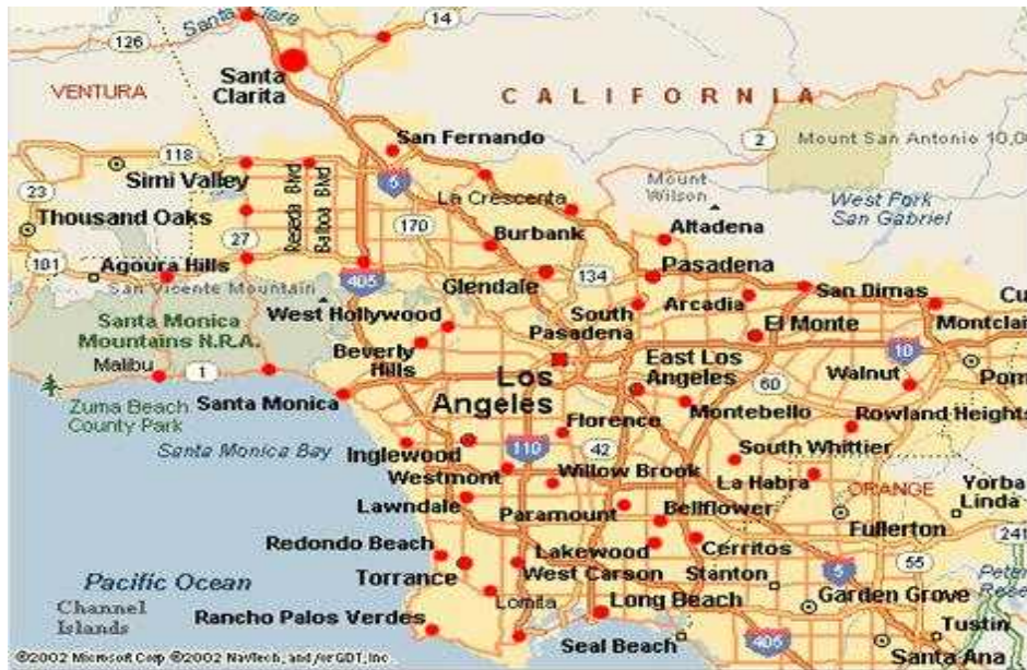
< 로스앤젤레스 카운티 지도 >