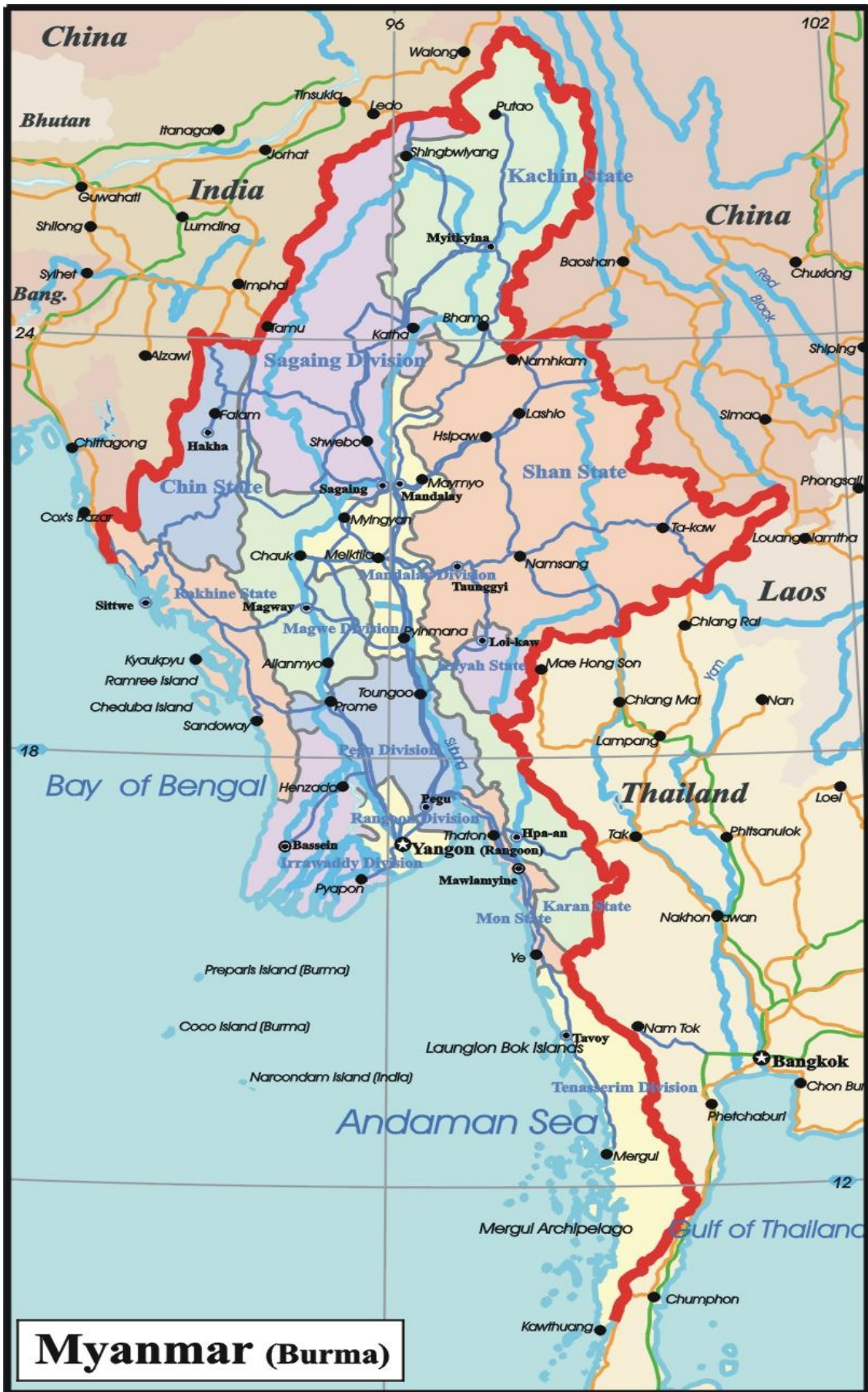
1992 Magellan GeographixSMSanta Barbara, CA (800) 929-4627