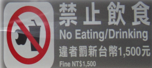
MRT내 식품 섭취 금지 표시