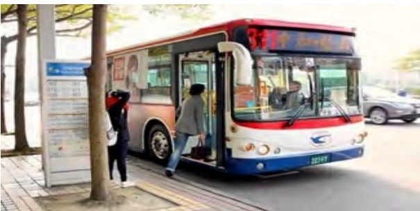
대만 버스정류장과 시내버스 모습