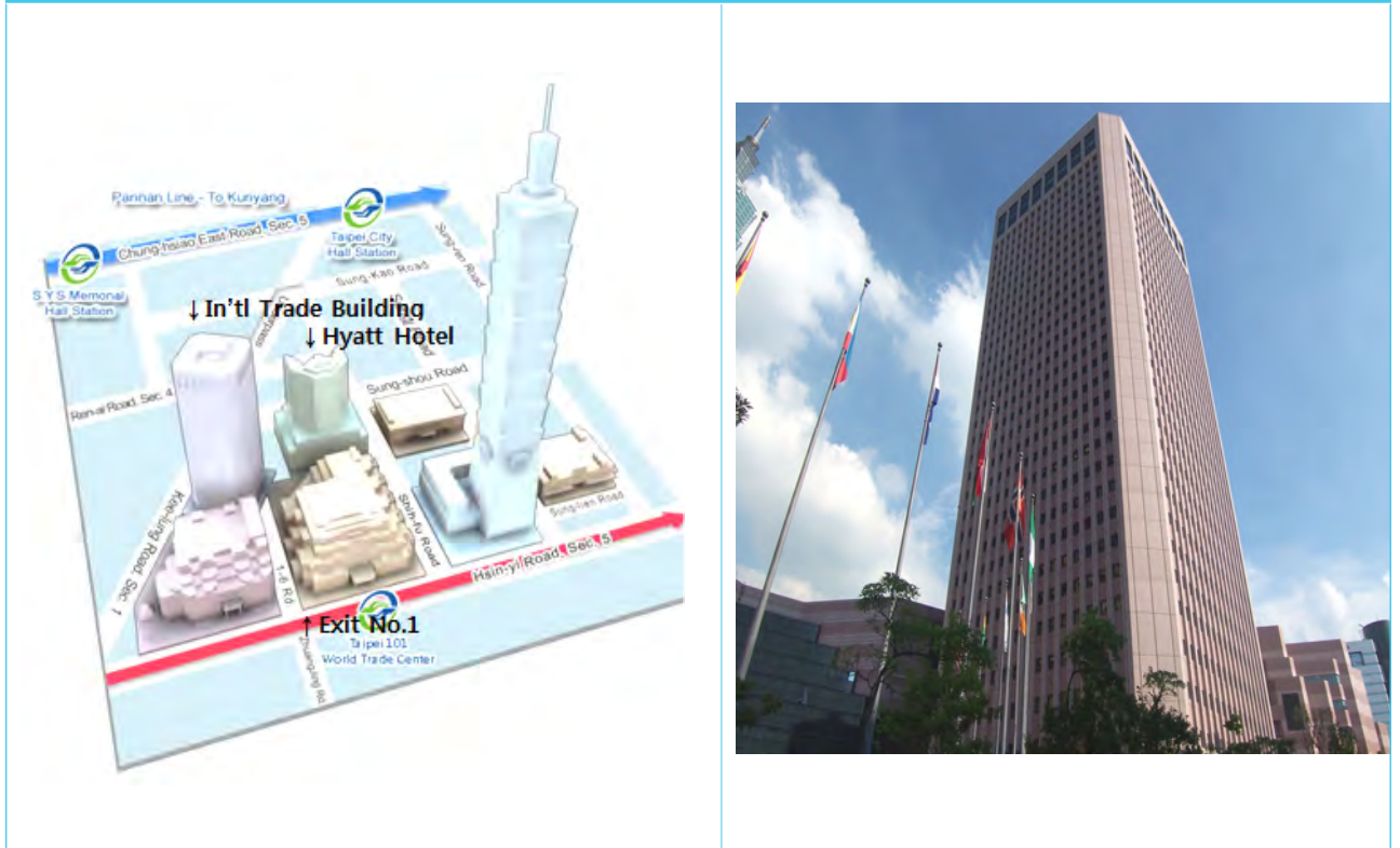
사진: Int'l Trade Building, Xuite