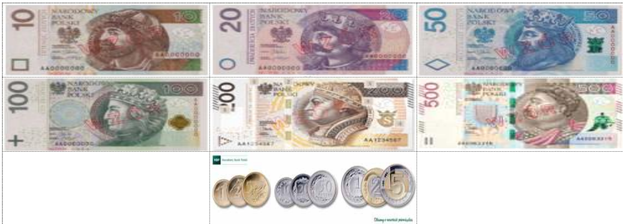
< 폴란드 지폐 및 동전 >