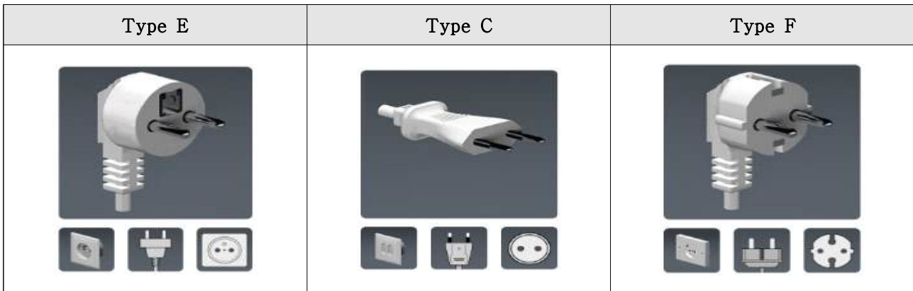
< 콘센트 타입 비교 >