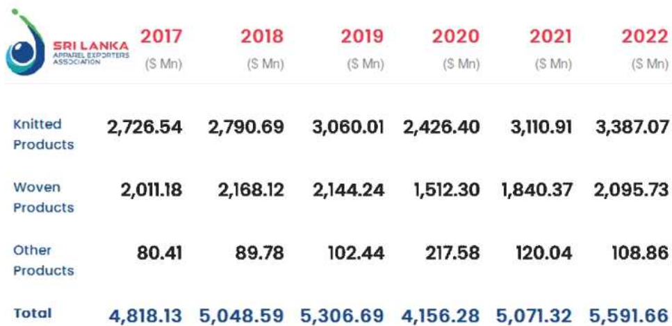
<스리랑카 봉제 수출 연간 수익>